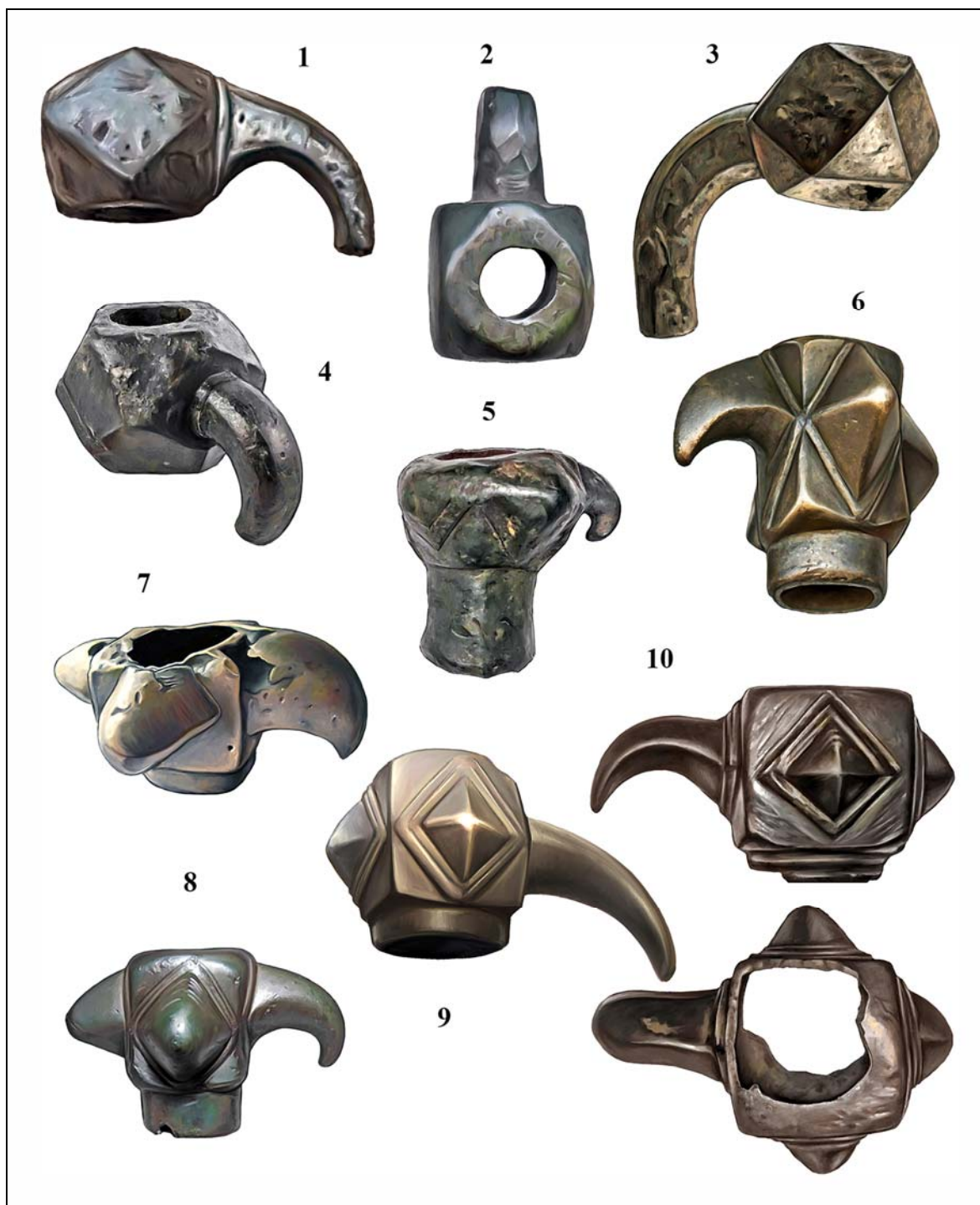
Рис. 4. Булавы-клевцы XIII—XIV вв.: 1 — с территории Украины; 2 — Волжская Булгария, Национальный музей республики Татарстан; 3 — Изяславль; 4 — Великий Новгород; 5 — музей «Куликово поле»; 6 — Волжская Булгария, Национальный музей республики Татарстан; 7 — Чернышковский казачий музей; 8 — с территории Украины; 9 — музей «Город» в Барнауле; 10 — Винницкая обл., Украина (рисунки автора).