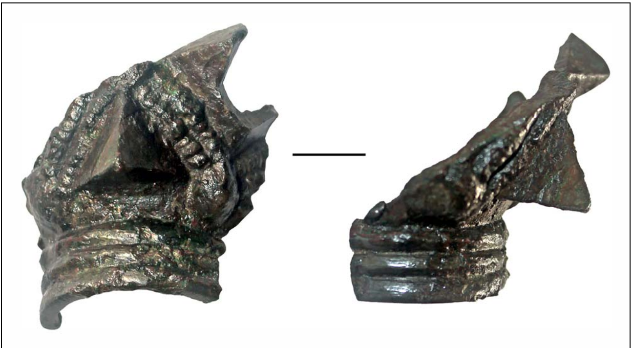
Рис. 2. Навершие булавы из раскопок на Театральной площади.