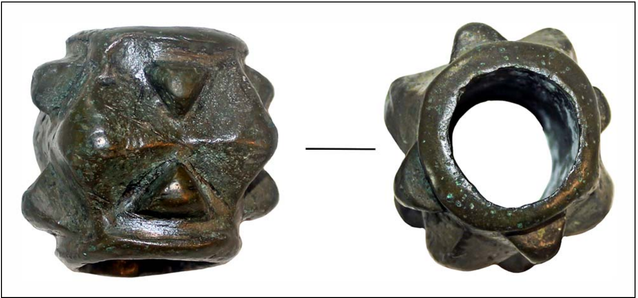
Рис. 1. Навершие булавы из раскопок на ул. Минина 1 (фото автора).