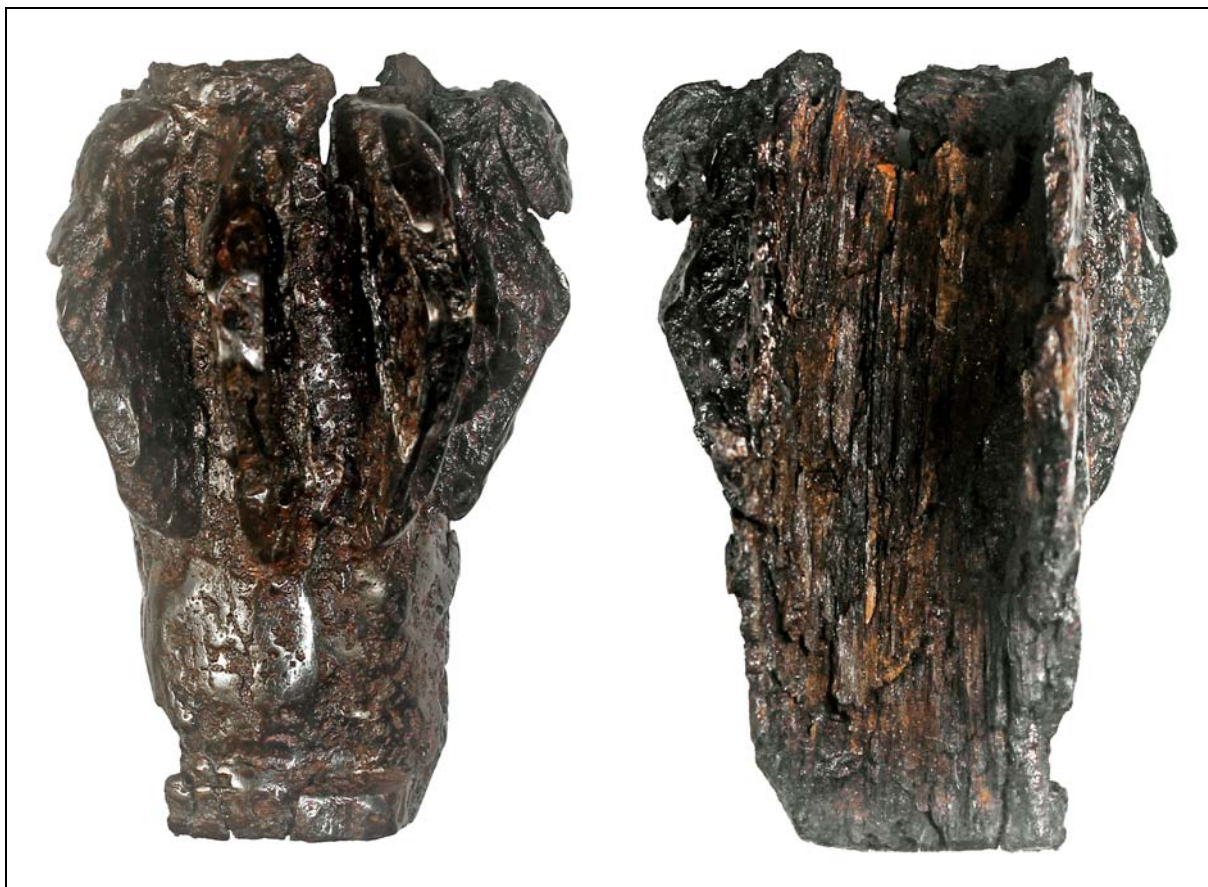
Рис. 5. Навершие шестопёра из Сарлейского могильника.