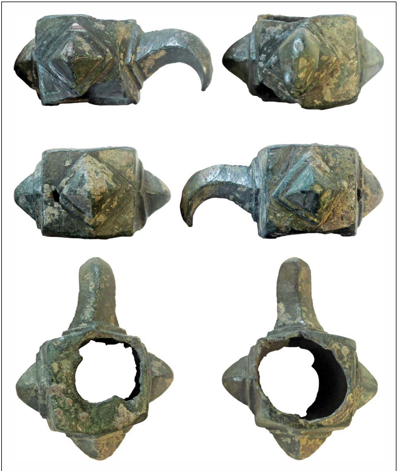
Рис. 3. Навершие булавы-клевца с селища Копнино-1.