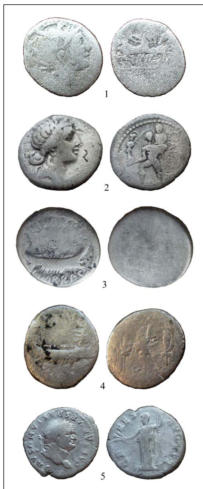
Рис. 1. Римские денарии, найденные в 2008—2013 гг. в Байдарской долине.