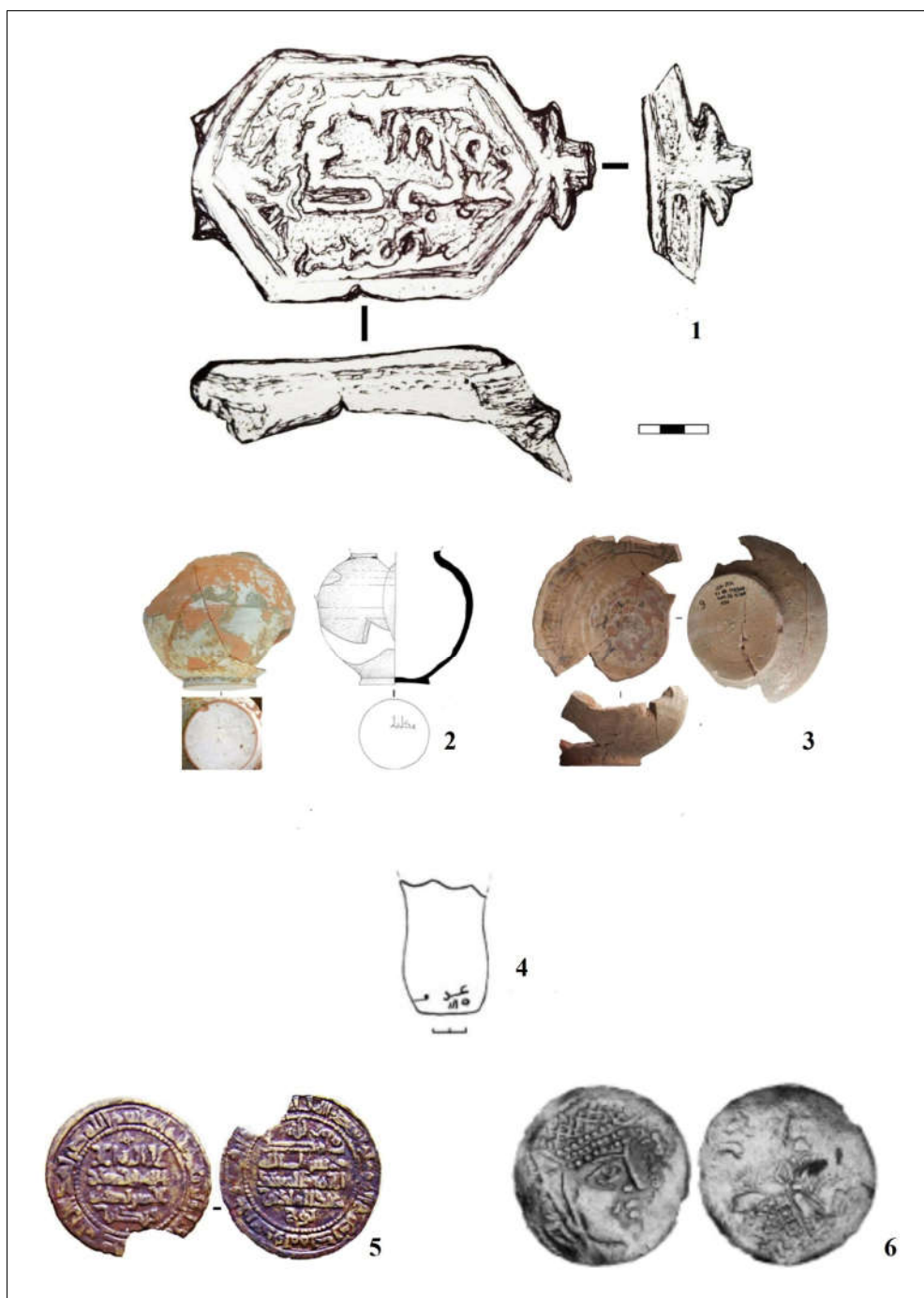
Рис. 2. 1 — Джанкент. Раскоп № 1. Перстень с надписью «Muhammad» (рисунок А. Назарова); 2—3 — Джанкент. Раскоп № 1. Фрагменты керамической посуды с куфической надписью; 4 — Джанкент. Цитадель. Фрагменты керамической посуды с куфической надписью (рисунок Ильина Р.); 5 — Джанкент. Раскоп № 1. Фельс, Саманид Абд ал-Малик ибн Нух 348 г.х / 959—960 гг.; 6 — Города Джанкентской группы. Драхма Огузского ягбу.