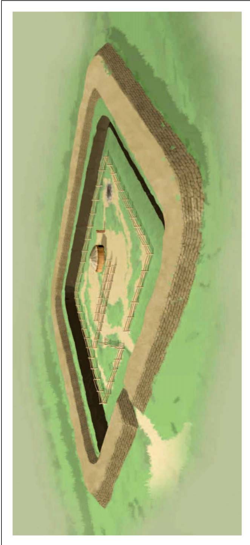
Рис. 5. Реконструкция северного квартала. Автор М.К. Хабдулина.