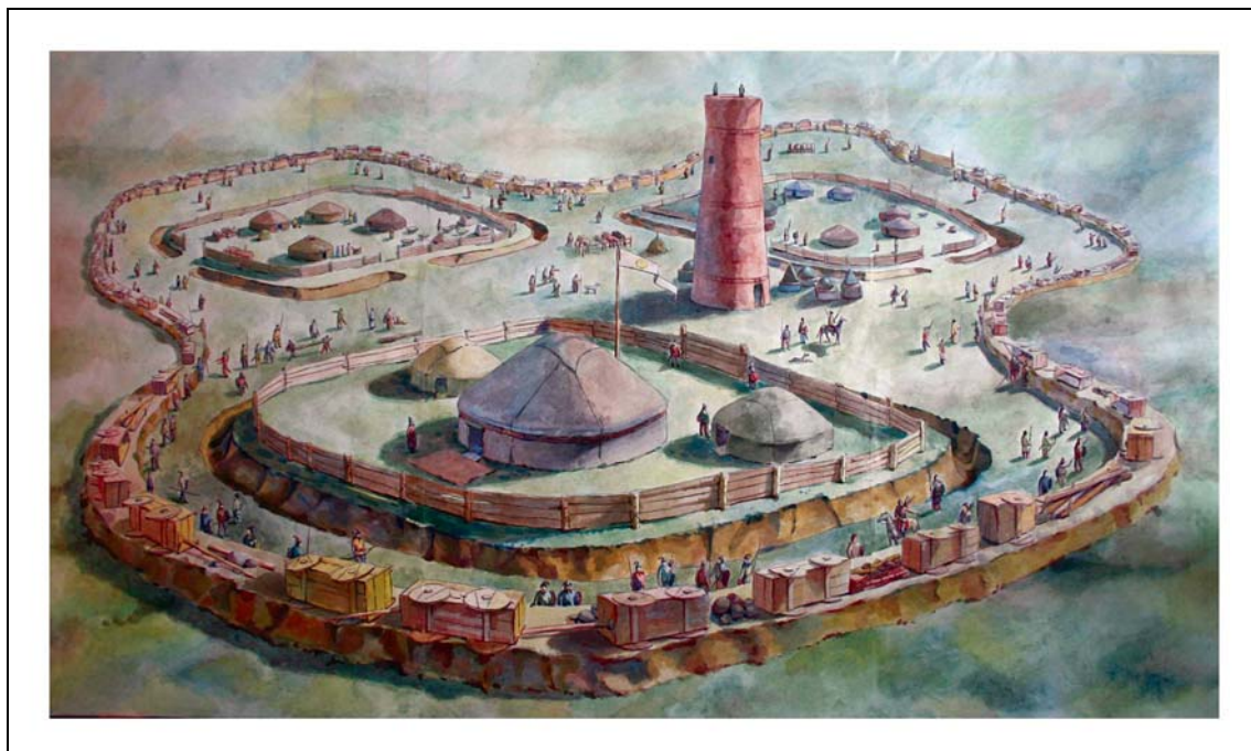
Рис. 2. Реконструкция городища Бозок. Автор К.А. Акишев.