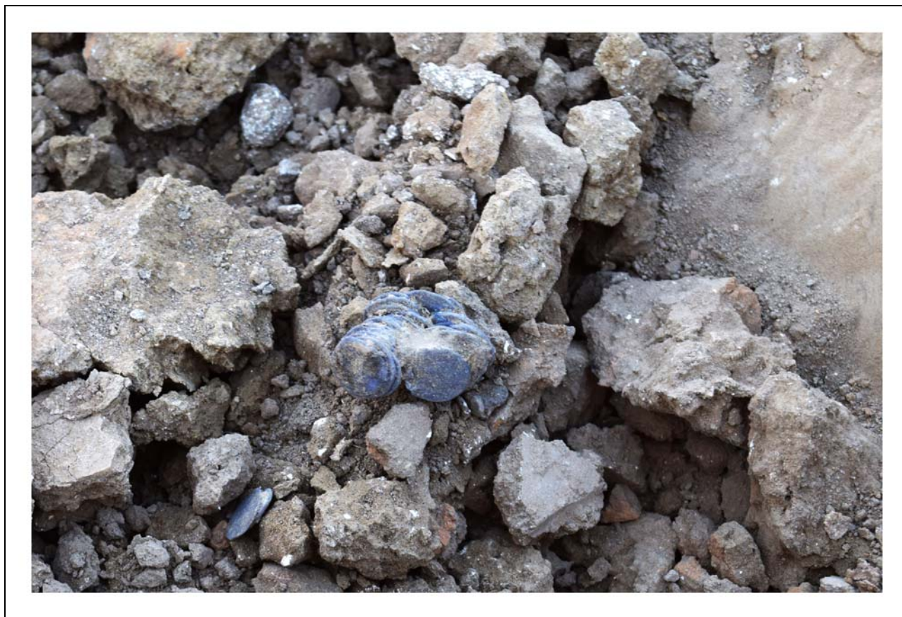
Фото 2. Слипшиеся монеты Пятого клада, найденные в раскопе № 3 в помещении № 5.

Клад был обнаружен в приповерхностном слое земли (на глубине 10 см) после того, как курхана была убрана. Монеты клада представляли собой несколько слипшихся комочков и несколько отдельных экземпляров, всего — 42 данга (Фото 2).