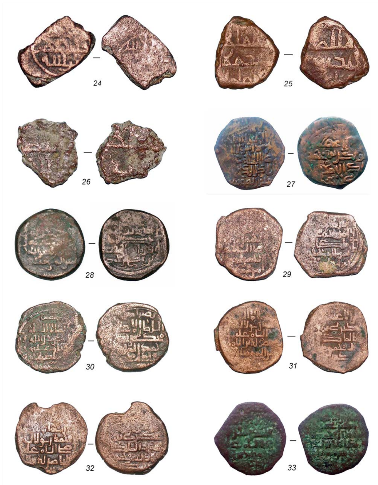
Рис. 4. Дербент. Раскоп XXIX. Монеты 24—33 (без масштаба).