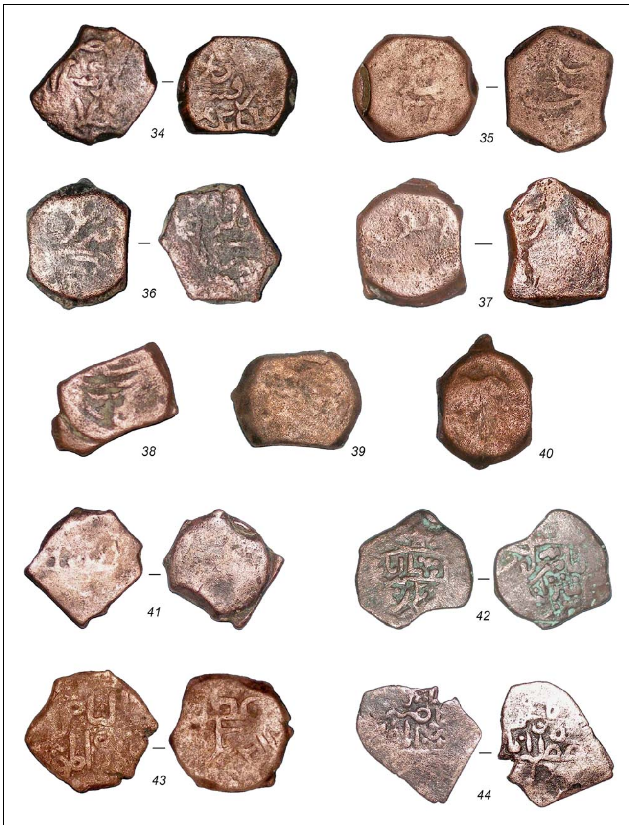
Рис. 5. Дербент. Раскоп XXIX. Монеты 34—44 (без масштаба).