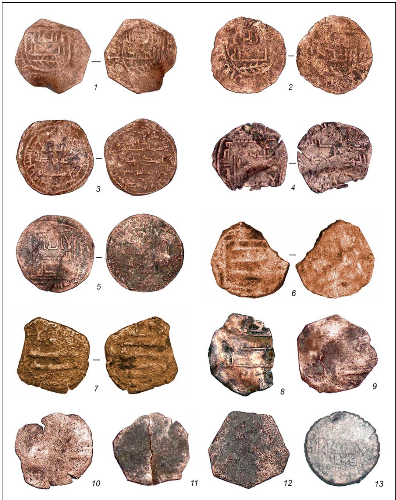
Рис. 2. Дербент. Раскоп XXIX. Монеты 1—13 (без масштаба).