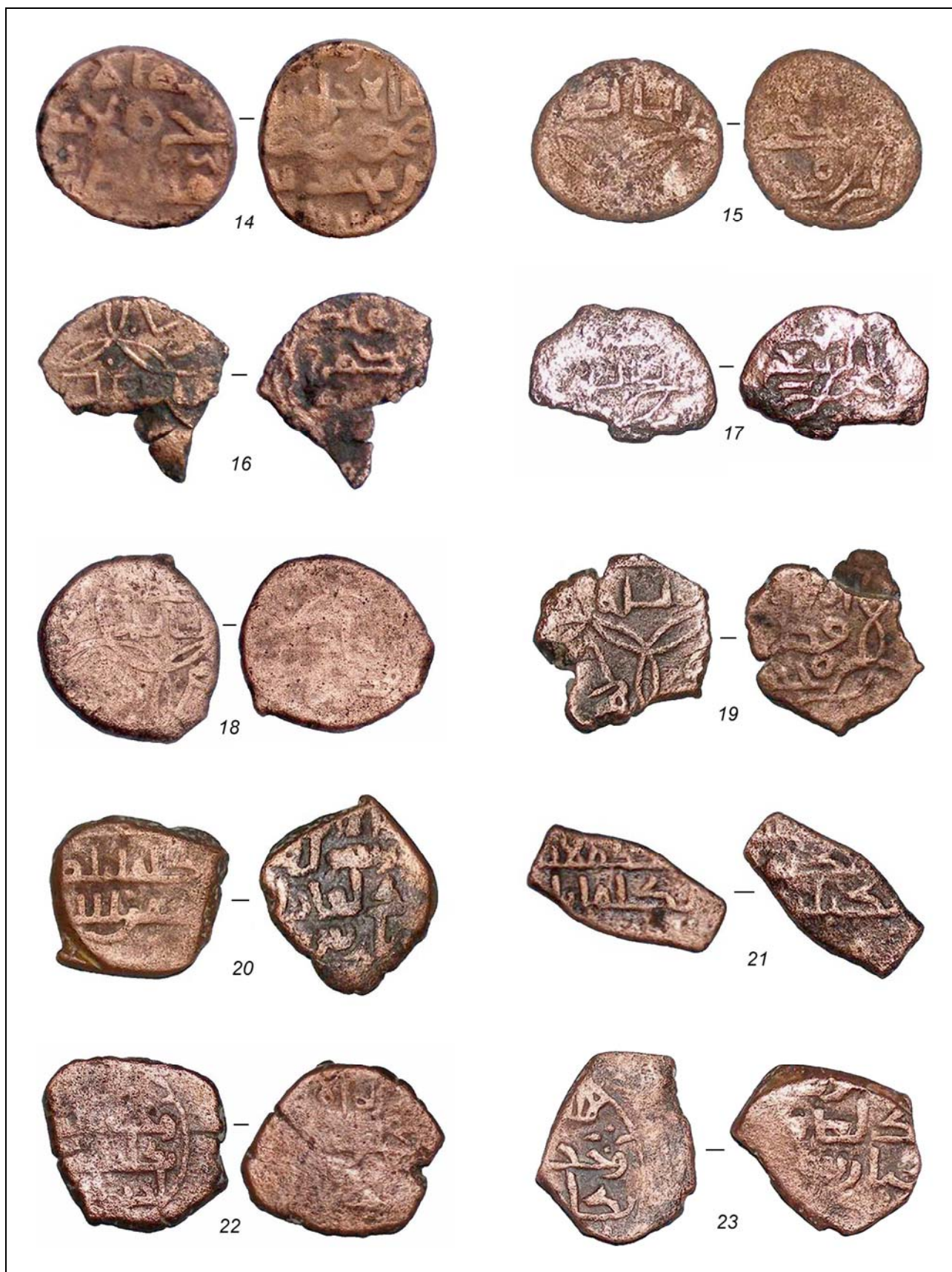
Рис. 3. Дербент. Раскоп XXIX. Монеты 14—23 (без масштаба).