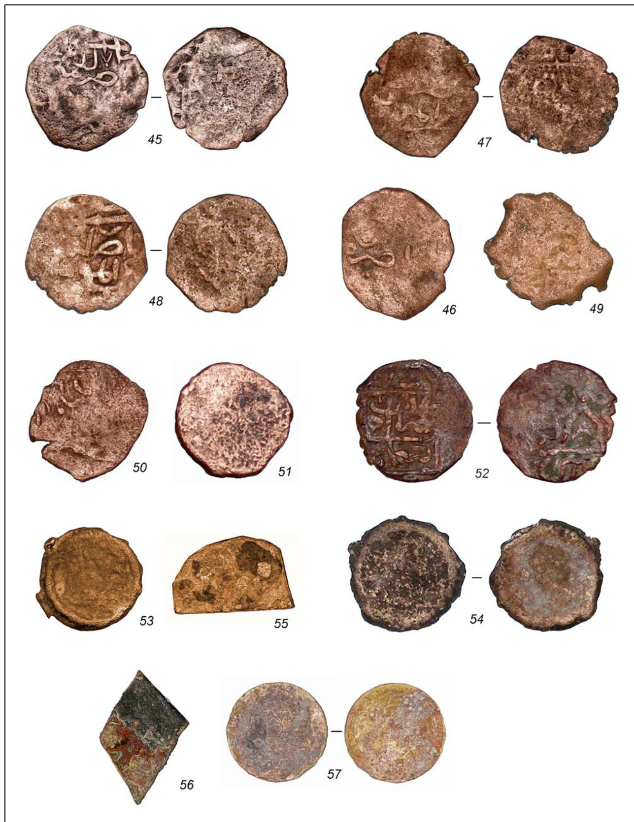
Рис. 6. Дербент. Раскоп XXIX. Монеты 45—57 (без масштаба).