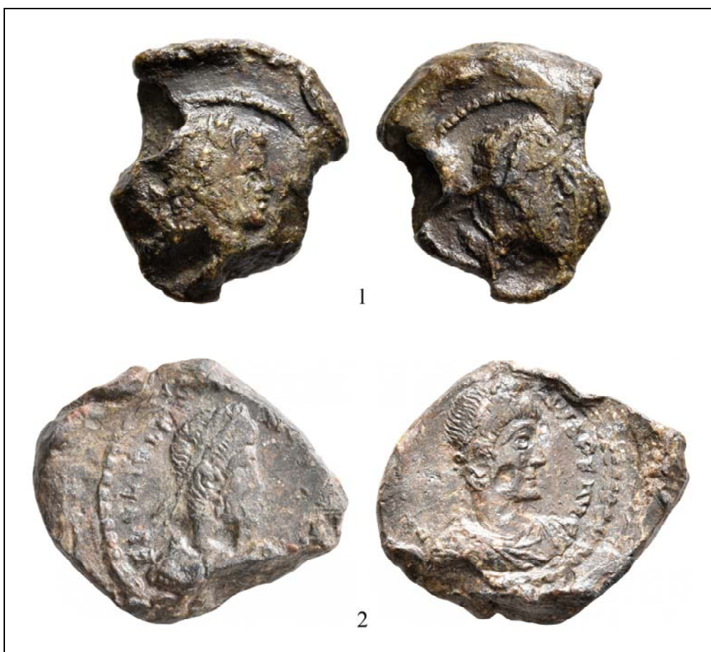
Рис. 1. Моливдовулы Каракаллы (1) (по acsearch.info: 2) и Прокопия (2) (по acsearch.info: 1).