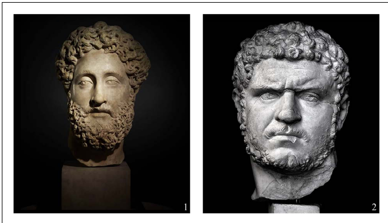
Рис. 2. Бюсты Коммода (1) (The British Museum, Inv. № 1864,1021.9) и Каракаллы (2) (Museo Capitolino Montemartini, Inv. № 2310).