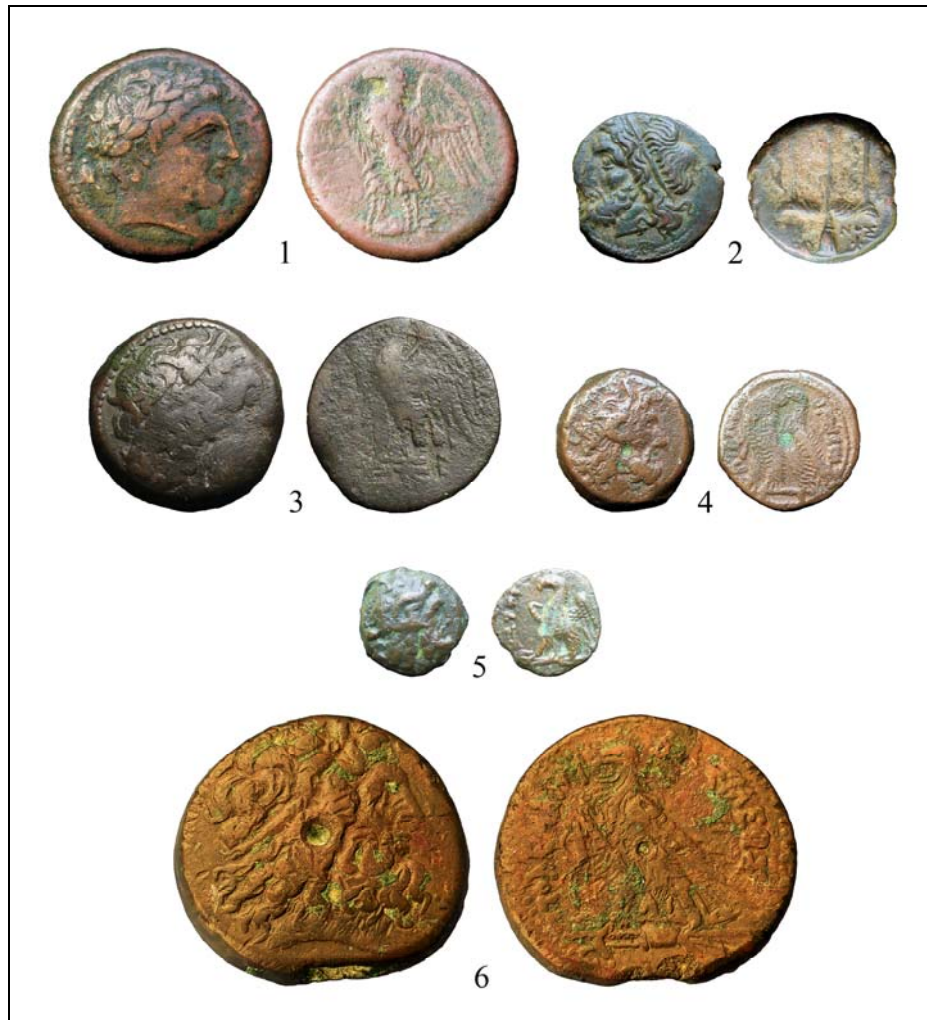
Рис. 2. Привозные античные монеты, найденные на холме Тавель: 1—5 — обнаруженные в начале 2000-х гг. (1 — АЕ 28 Гикета II; 2 — АЕ 20 Гиерона II; 3 — обол Птолемея II Филадельфа; 4 — гемиибол Птолемея VI Филометора и Птолемея VIII Эвергета II; 5 — халк Птолемея VIII Эвергета II, Птолемея IX Сотера II Лафура или Птолемея X Александра I); 6 — драхма Птолемея IV Филопатора, найденная в 2022 г..