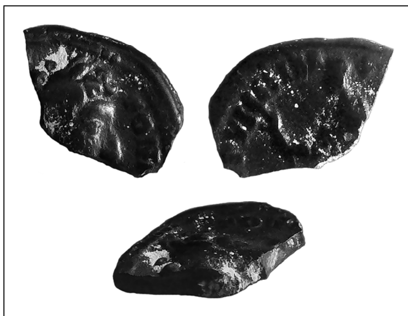
Рис. 3. Обломок лimesного денария.