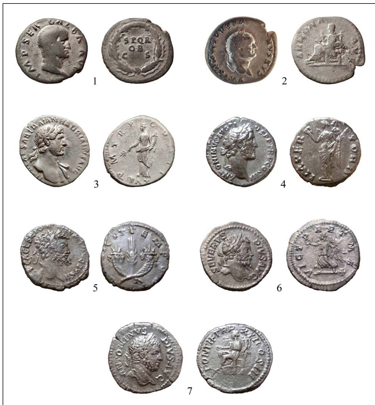
Рис. 1. Римские денарии, найденные в Байдарской долине (подъемный материал).