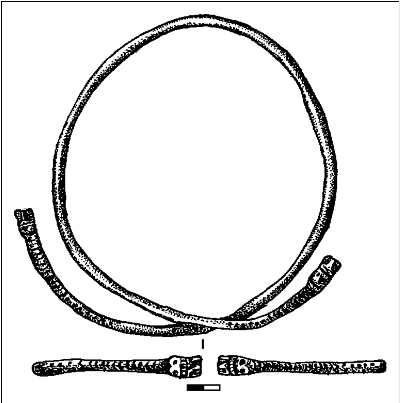
Рис. 1. Гривна из погребения 1 кургана 13 могильника Дервент на левобережье Нижнего Дуная (по Островерхов, Редина 2013: рис. 100: 22).