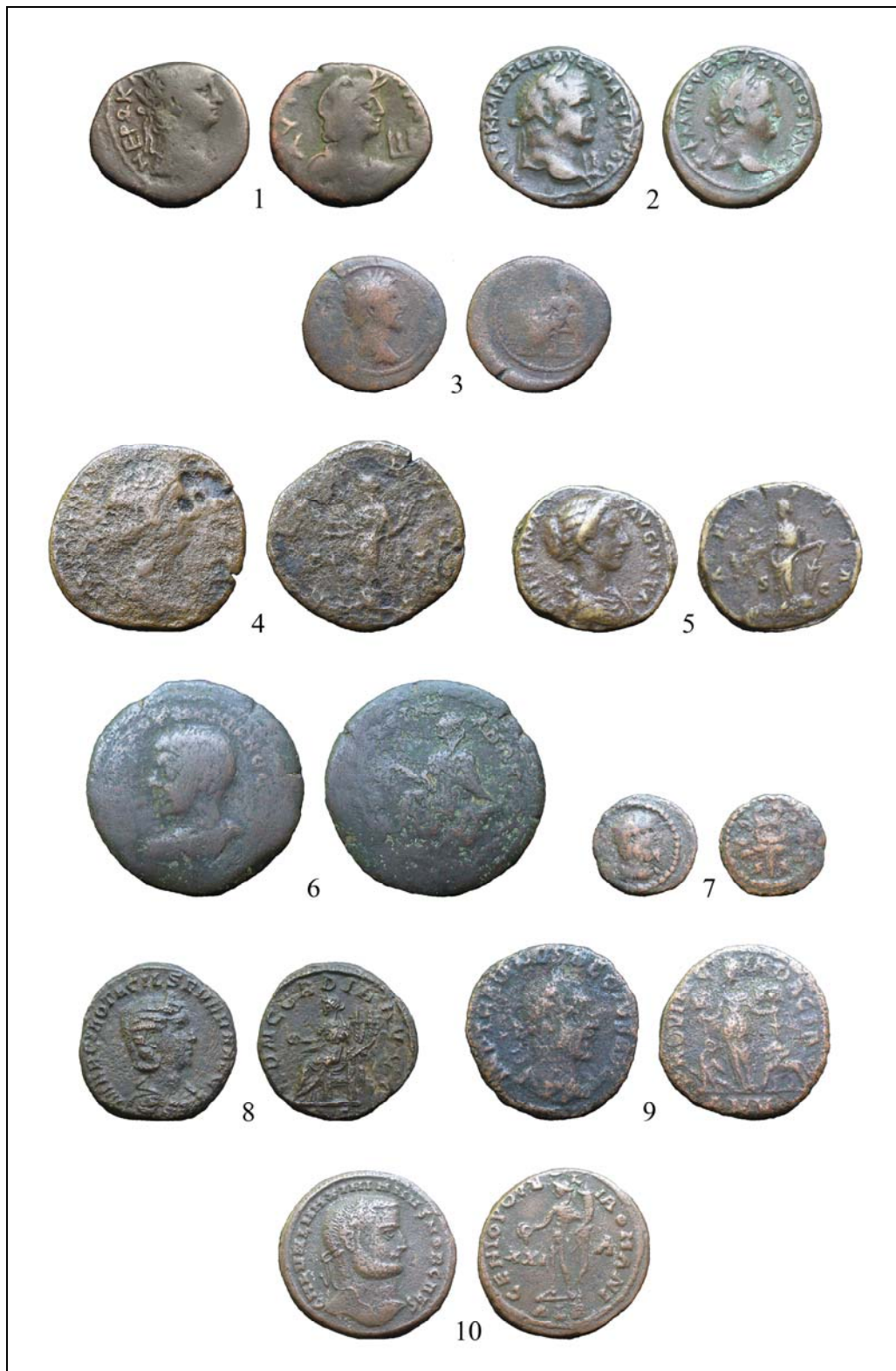
Рис. 2. Античные монеты, обнаруженные близ пос. Почтовое.