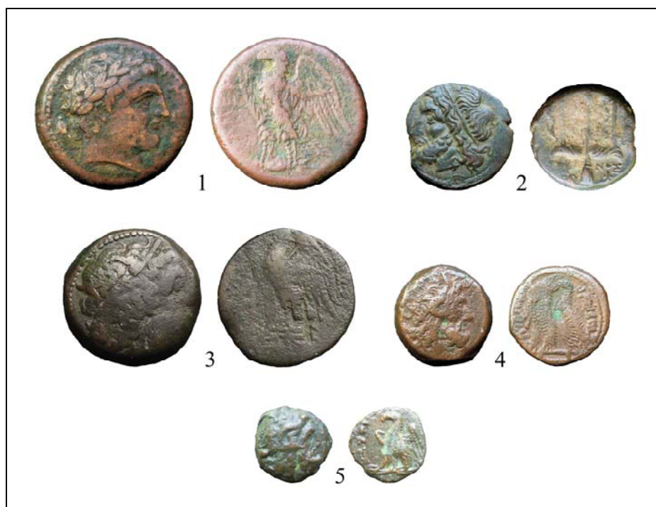
Рис. 2. Монеты, найденные на холме Тавель.