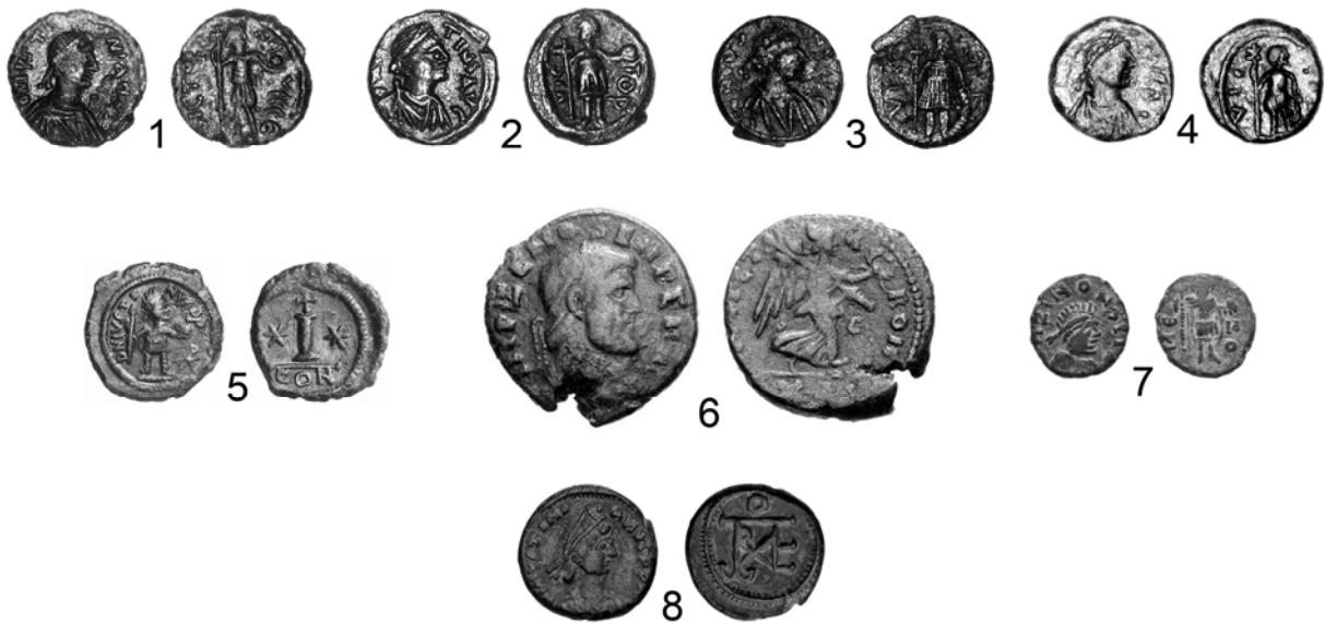
Рис. 2. К истории монетного дела византийской Таврики при Юстиниане I

1—4 — херсонские декануммии Юстиниана I серии «VICTORIA AVGGGE» (по М. В. Бутырскому и Я. В. Студицкому); 5 — константинопольский декануммий Юстина I; 6 — фоллис Зинона, чекан Рима; 7 — \text{Æ}3/4 Зинона, чекан Константинополя; 8 — пентануммий Юстиниана I серии «πόλις Χερσῶνος».