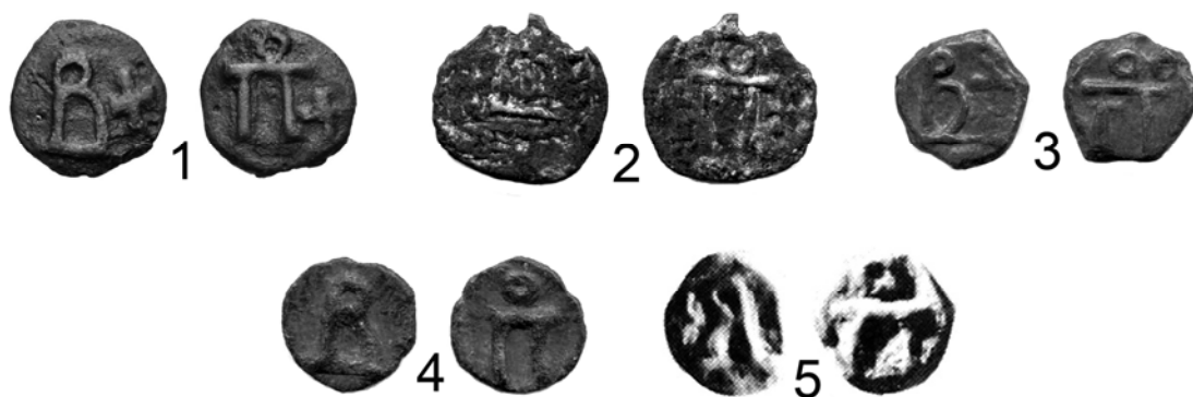
Рис. 3. Гемифоллисы времен Василия I Македонянина