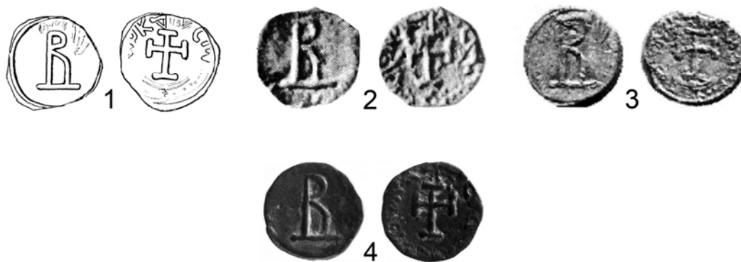
Рис. 1. Херсоно-византийские монеты с «В» на аверсе и с крестом, окруженным надписью ΒΑΣΙΛΕΙΟΥΣ ΛΕΩΝΚΟΝΣΤΑΝΤΙΝΟΥΣ на реверсе.