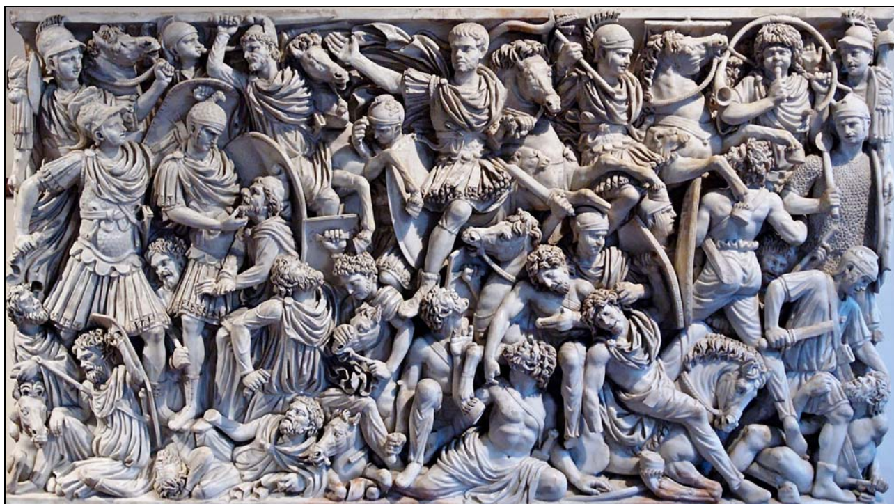
Рис. 3. Горельеф саркофага Людовизи. Национальный музей Терм.