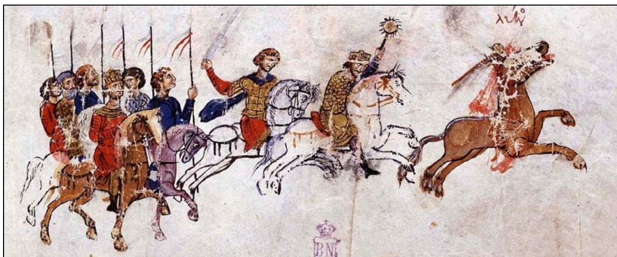
Рис. 3. Охота императора Михаила III. Василий Македонянин метает булаву в волка. Миниатюра из мадридского списка «Обзрения истории» Иоанна Скилицы (по MS Graecus Vitr. 26-2. P. 209).