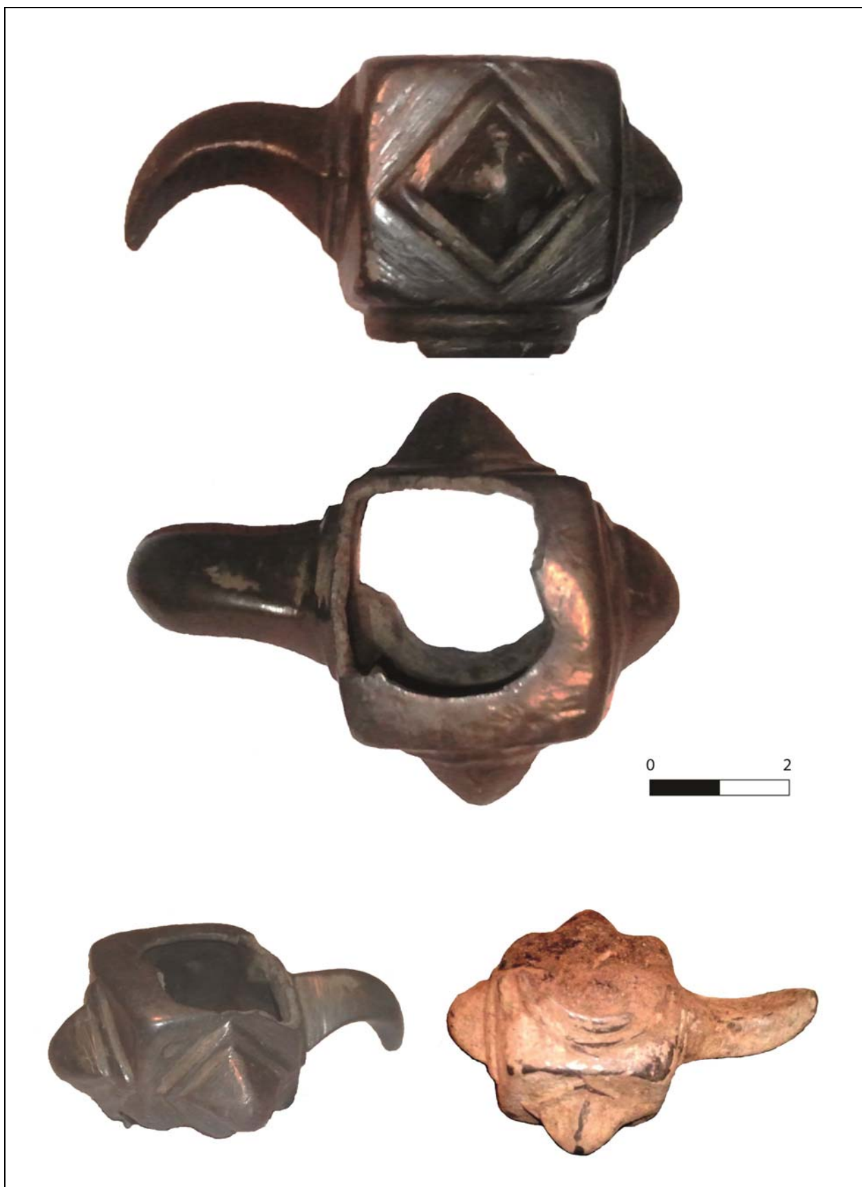
Рис. 1. Навершие булавы с территории Винницкой области.