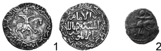
Рис. 3. Дирхем Рукн ад-дин Кылыч-Арслана IV и пул серии «القوه قريم» Разновидности IV.