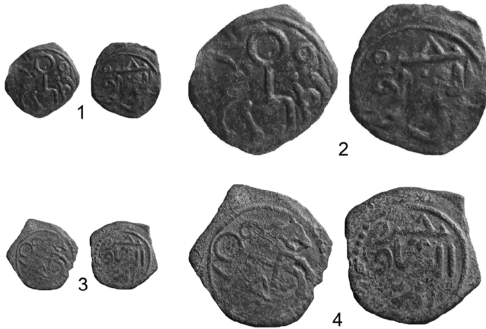
Рис. 2. Перечеканенные монеты серии «القوه قريم» 1,3 – натуральная величина; 2,4 – увеличено в два раза.